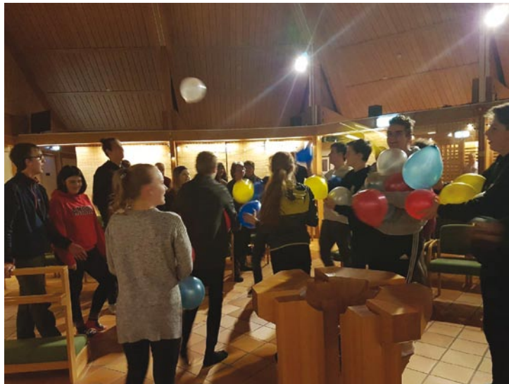
Kroa startar alltid med ein leik, og denne gongen var det "Ballongleiken".