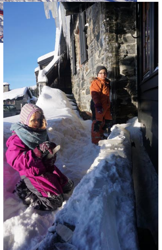
Istappar er gøy!