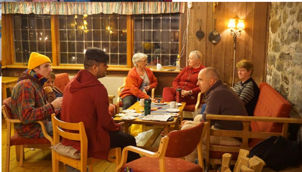
2 av gjestane frå Acta i ivrig samtale med presten i peisestova.