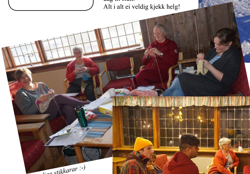
Iherdige stikkarar :-)